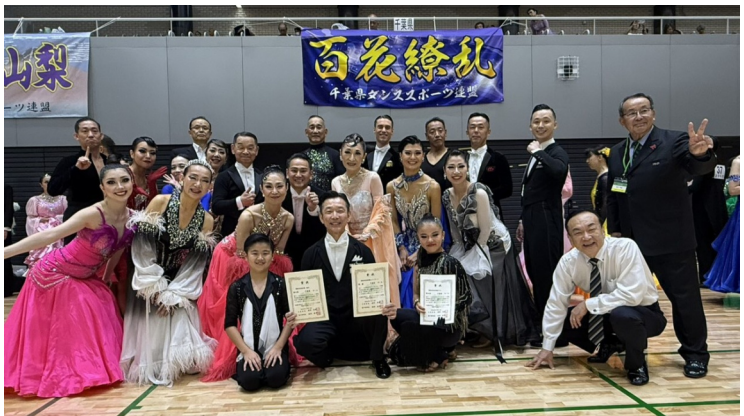
関東甲信越ブロック選手権で活躍した千葉県チーム