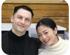
オレクシー・太田組 決勝は2ヒート、同時に踊る組数は少なく、YouTube配信、そ

5種目戦を望むシニア選手の要望に因って競技会を企画し、まず、どのくらいの選手が集まるか、また、シニアIVの選手が問題なく5種目戦をこなすことができるかを検証します。7人審査、5種目戦（最終予選から）、ヒート割は縦割り、スタンダードの準