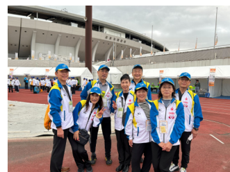
開会式の長良川競技場

10月18日、長良川競技場での開会式に参加した時は、郡上踊りから始まり各県の応援合戦や催しも沢山あり、さすが全国大会だと感動し圧倒されました。