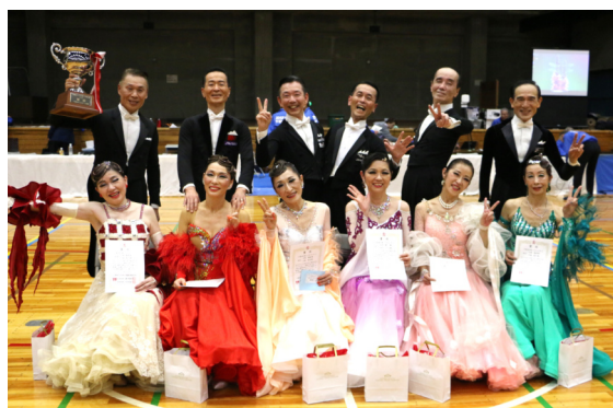
千葉県選手権シニアIVスタンダード入賞者