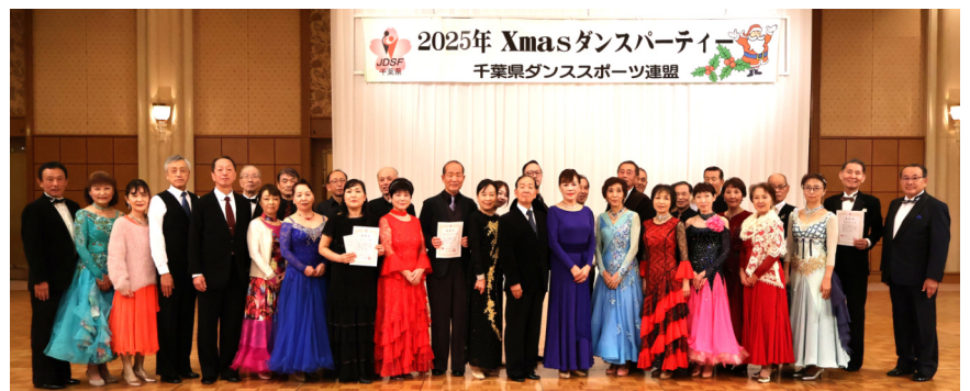
サークル表彰の皆さん