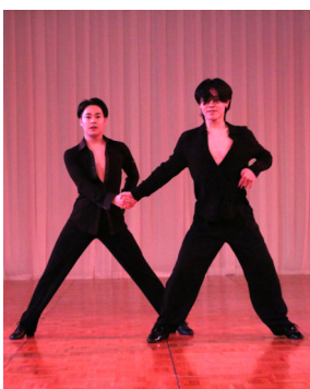
サプライズのミニショー

ルに表彰状と金一封が贈呈されました。 【西支部】松ヶ丘ダンスクラブ、ダンス美咲会【北支部】ダンススポーツチャレンジ【東支部】AZダンススポーツカンパニー、レバンガ成田、コンパニーニョ 【中央支部】サザンクロスダンスクラブ（分席）