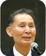
奥田大会会長 ありました。この大会により、シニア選手も十