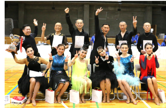
千葉県選手権シニアIVラテン入賞者